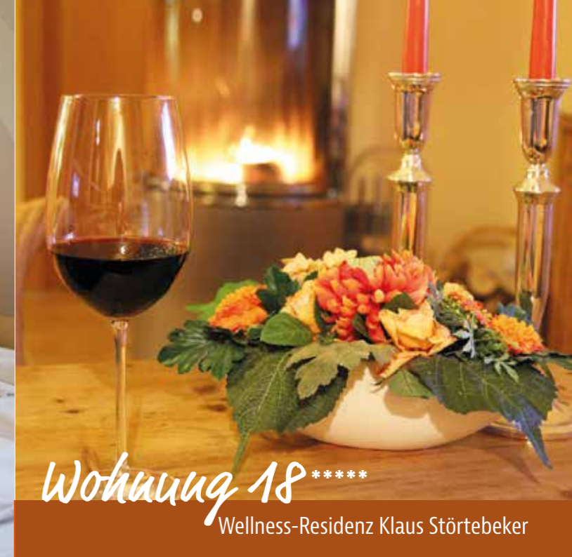
Wohnung 18 ***** Wellness-Residenz Klaus Störtebeker