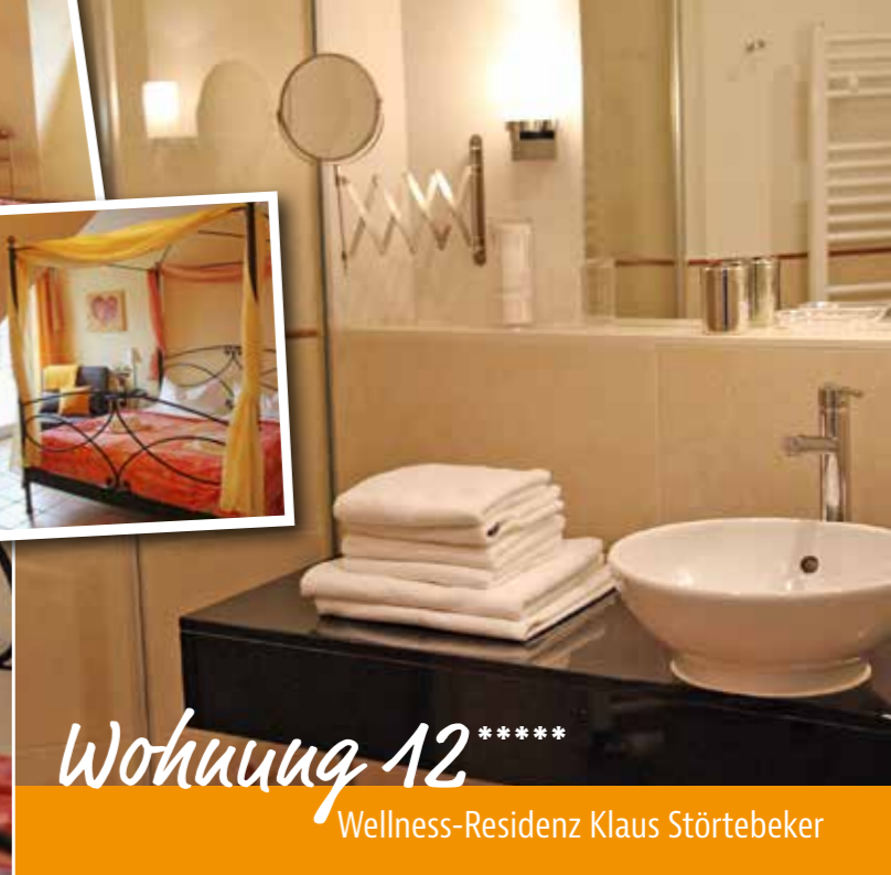
Wohnung 12**** Wellness-Residenz Klaus Störtebeker