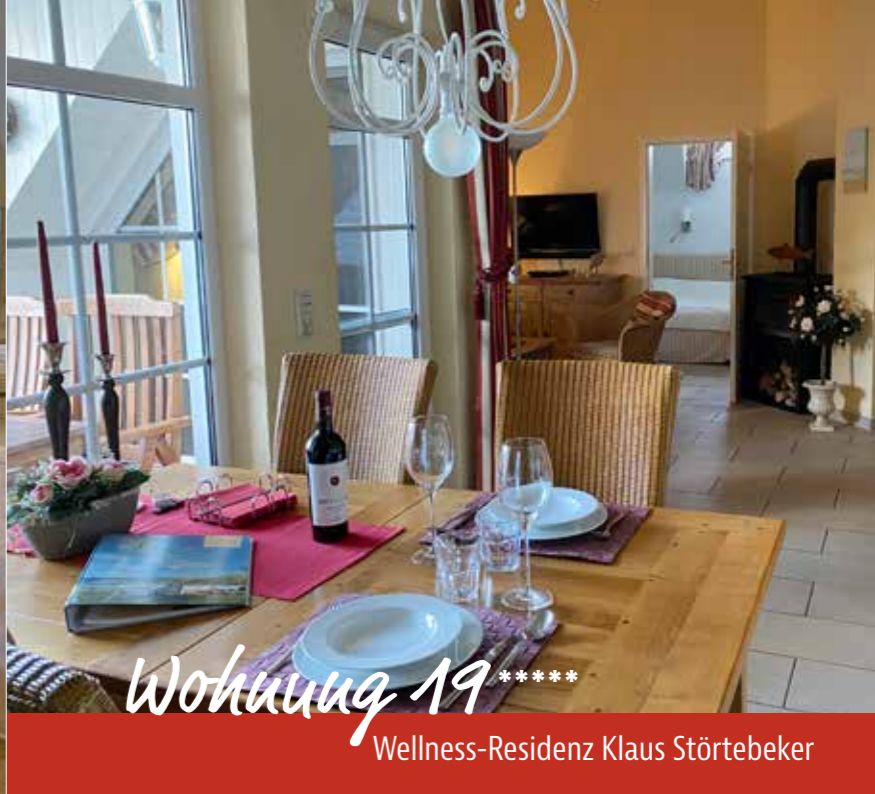
Wohnung 19**** Wellness-Residenz Klaus Störtebeker